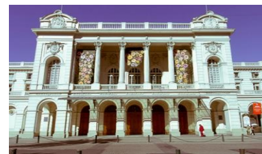
Teatro Municipal de Santiago