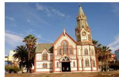
Catedral de San Marcos, Arica.